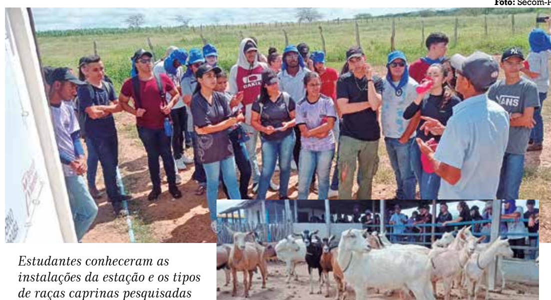
Estudantes conheceram as instalações da estação e os tipos de raças caprinas pesquisadas