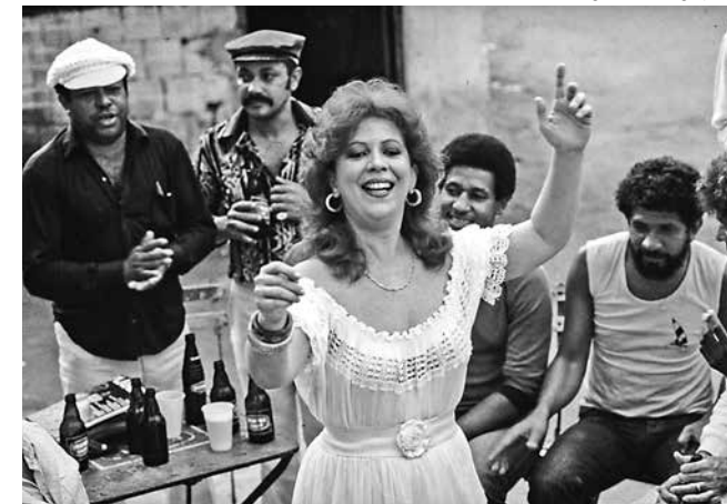
Documentário mostra a vida e obra da sambista Beth Carvalho