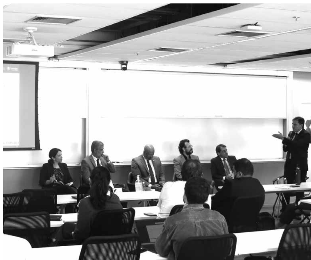
O 2º Balanço das Políticas de Gestão foi realizado pelo Instituto Sou da Paz na quarta-feira

“A Paraíba segue na liderança em relação aos resultados, pois também houve uma queda significativa na taxa de homicídios, que saiu de 44 por 100 mil habitantes para 27 no ano passado, e a ampliação dos indicadores, que dá um panorama geral em relação a essa política de segurança pública”, afirmou o tenente-coronel, ressaltando a oportunidade de troca de experiências para qualificar ainda mais a atuação do estado, em parceria com a Academia e os institutos.