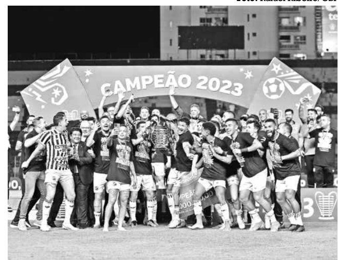
Jogadores do Ceará comemoram a conquista da Copa