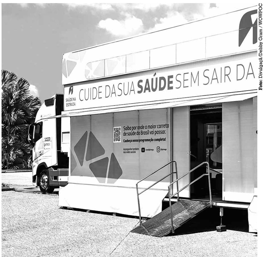
Caminhão do projeto realizará os atendimentos em um posto de combustíveis no Distrito Industrial

Mais informações, podem ser obtidas pelos telefones: 98839-1152, 3218-5092 ou 3218-5090.