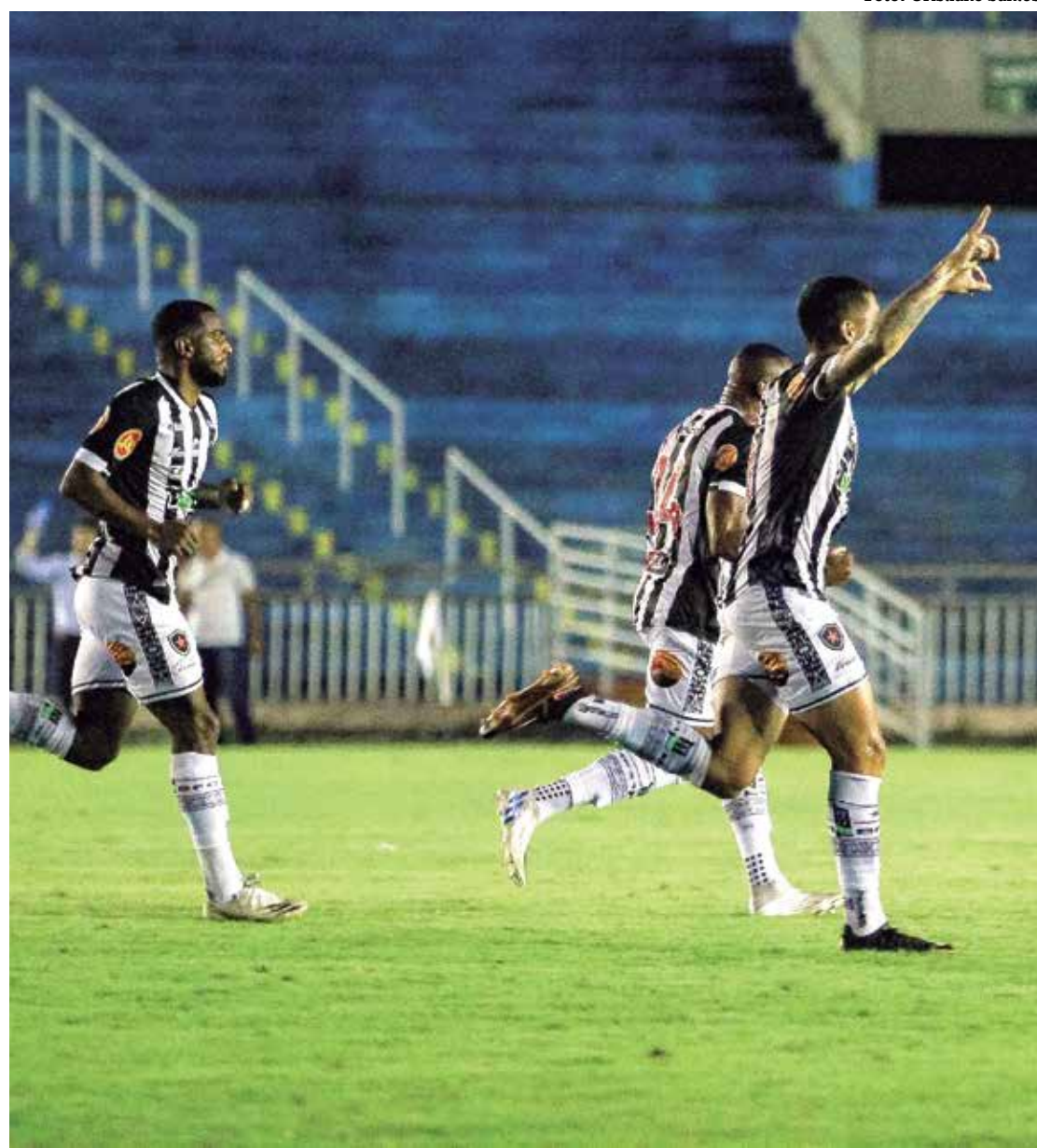
Belo fez 2 x 1 no Operário-PR, ontem à noite, no Estádio Almeidão, na estreia do Brasileiro da Série C

No segundo tempo, o Botafogo caiu de produção, principalmente com as saídas de Wesley e Netinho,