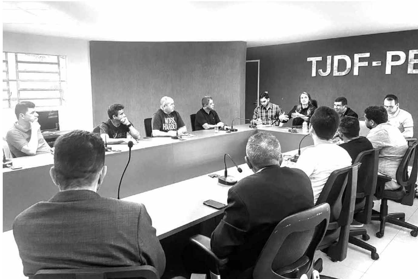
Dirigentes de clubes e da federação se reuniram para definir o formato e o número de clubes do Paraibano Sub-20