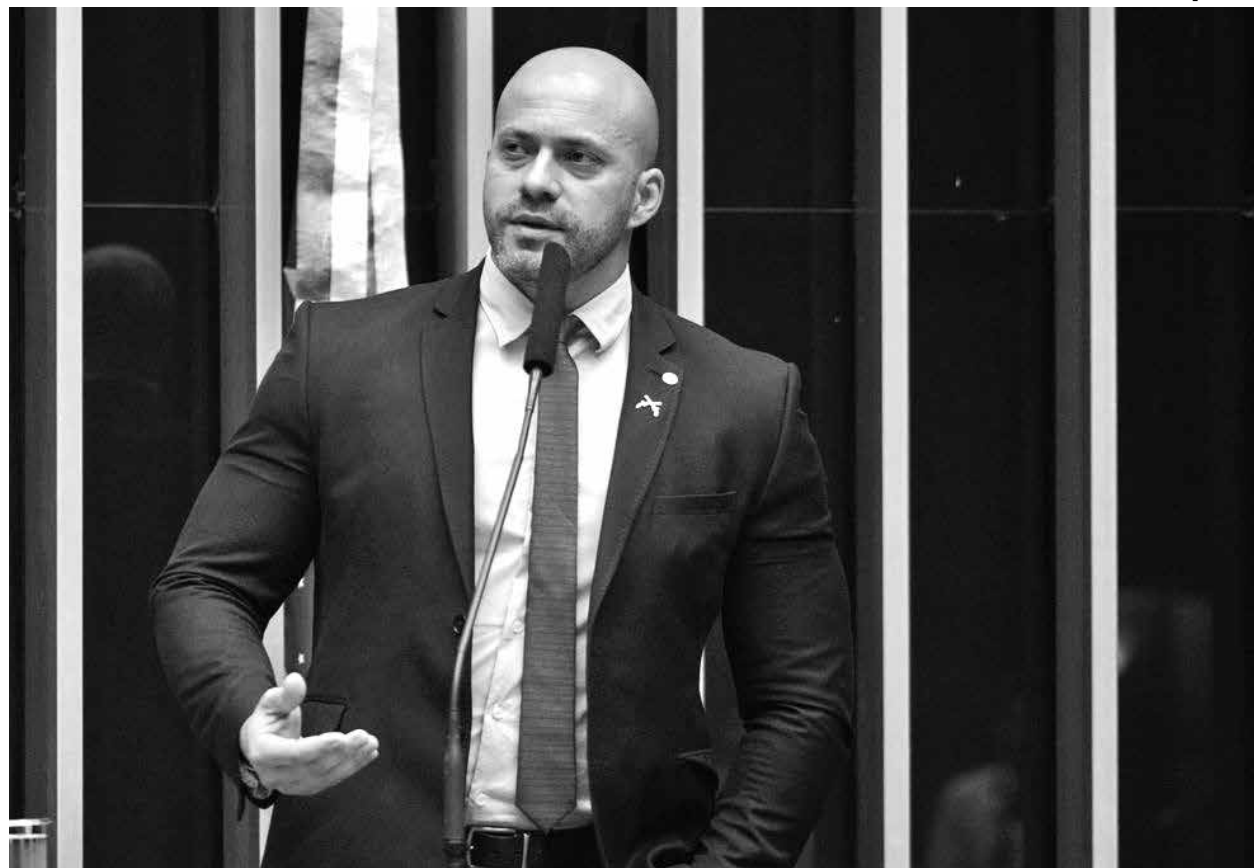
Em maio de 2022, Bolsonaro assinou um decreto concedendo o perdão da pena ao ex-deputado Daniel Silveira

■ Daniel Silveira foi condenado pelo STF a oito anos e nove meses de prisão pelos crimes de tentativa de impedir o livre exercício dos poderes e coação no curso do processo