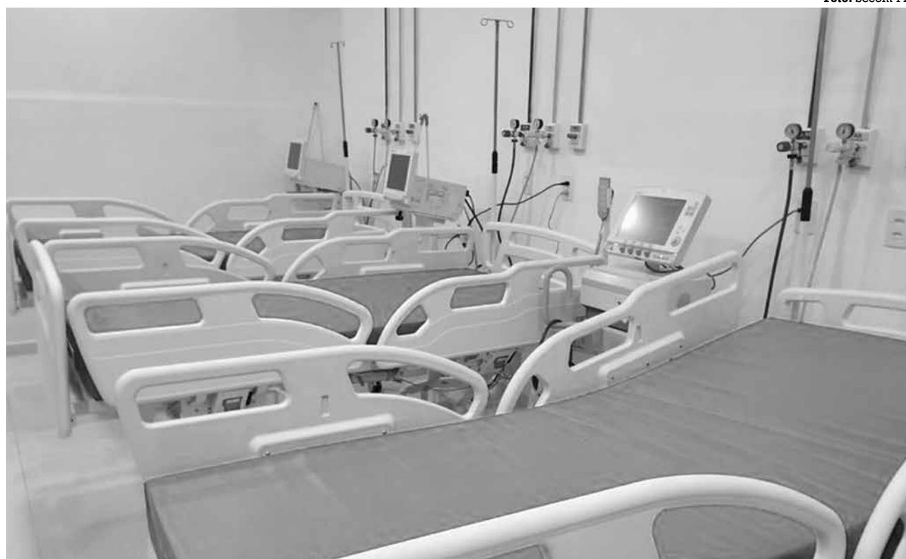
Crescente de casos está relacionada, também, com o período do ano com maior circulação de vírus diversos

A maioria das vítimas residia em João Pessoa (12), seguida por Bayeux, Itabaiana, Monteiro e Sousa (com três registros em cada cidade); Mamanguape e Santa Rita (com dois casos); Alhandra, Caaporã, Cabedelo, Cajazeiras, Capim, Cubati, Lucena, Montadas, Patos, Piancó, Pirpirituba, Queimadas, Santana de Mangueira, São João do Rio do Peixe, São José do Sabugi, São Mamede, Sapé e Sumé (com um caso cada).