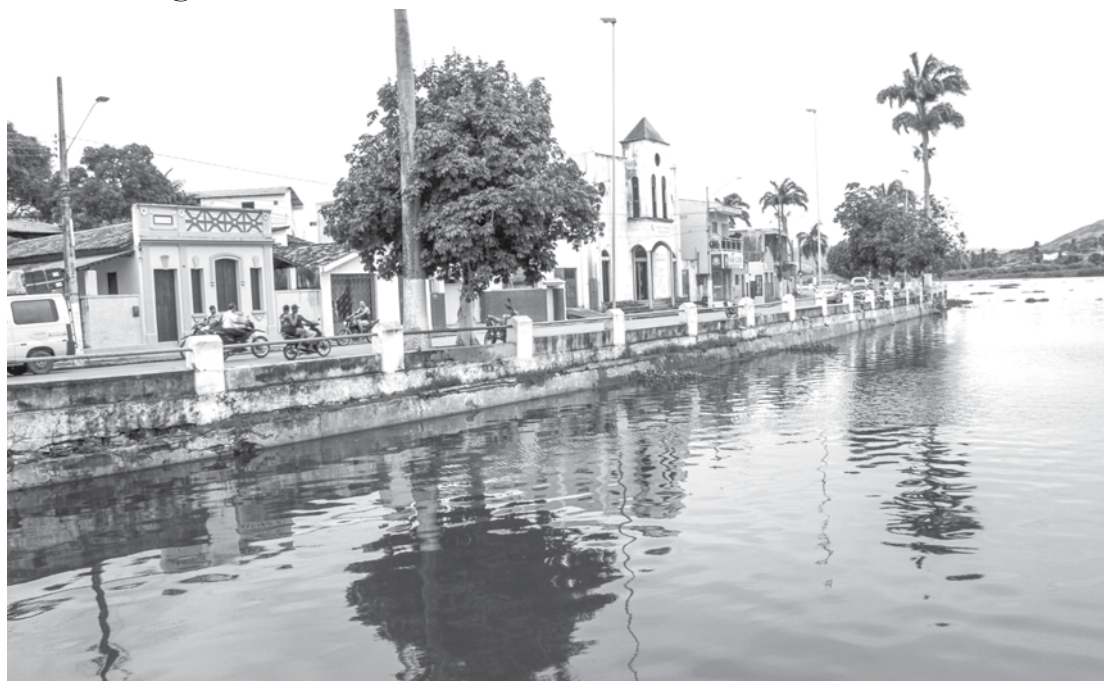
O rio e a civilização