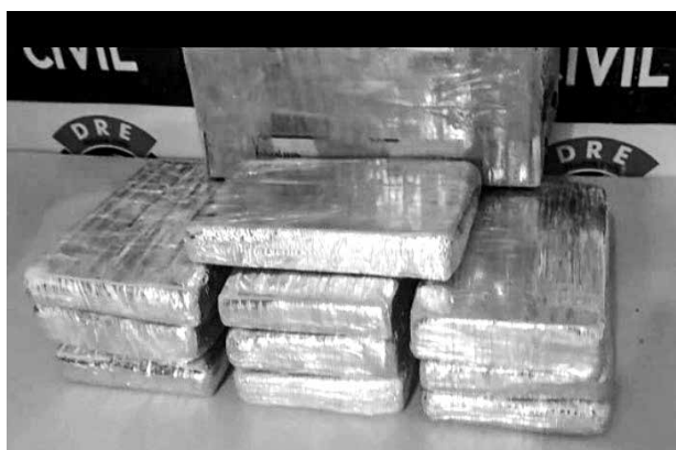
Apreensão da droga aconteceu na madrugada de ontem

Policiais da Delegacia de Repressão ao Entorpecente, de Campina Grande, realizando buscas na tentativa de localizar um grupo que estava em um veículo, onde foram encontrados aproximadamente 10 quilos de cocaína.