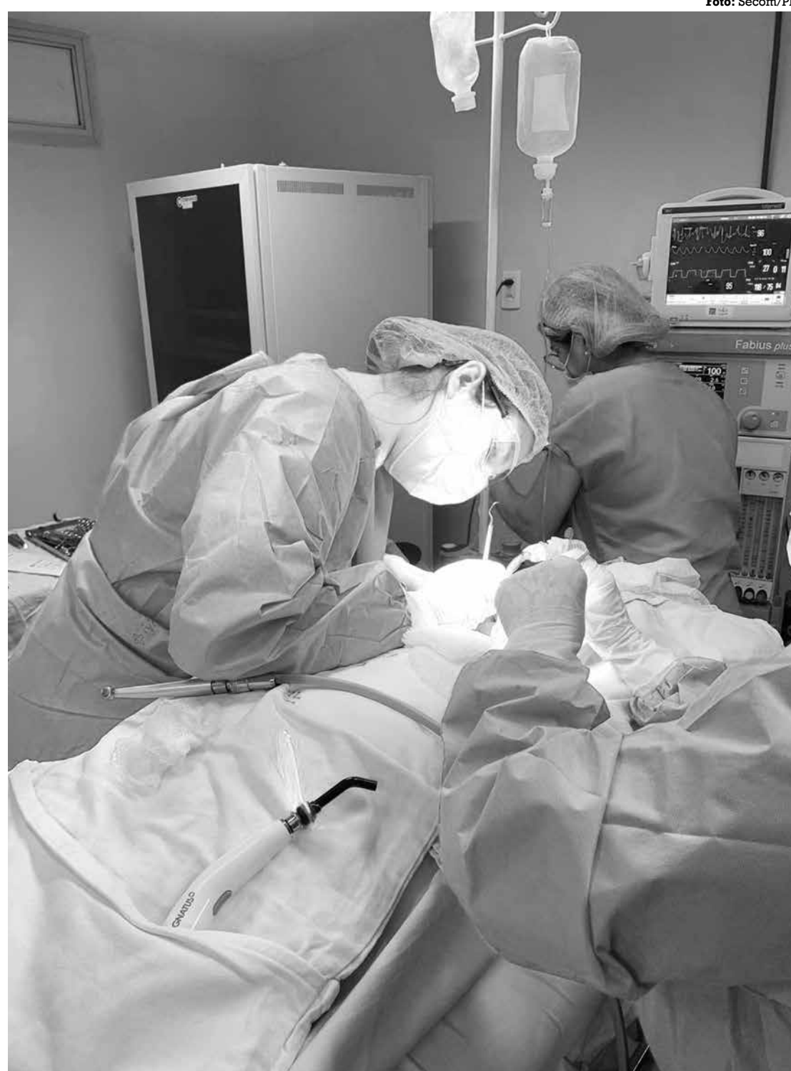
Em 2023, o programa já realizou 12.610 procedimentos entre as 81 especialidades atendidas

Outra opção é por meio da internet, onde o interessado deverá acessar a página do Opera Paraíba, www.operaparaiba.pb.gov.br , preencher o formulário, anexando seus exames e o laudo médico que confirme a necessidade de uma cirurgia. Então, o paciente é classificado pela Central de Regulação e encaminhado para o Hospital Regional executante mais próximo.