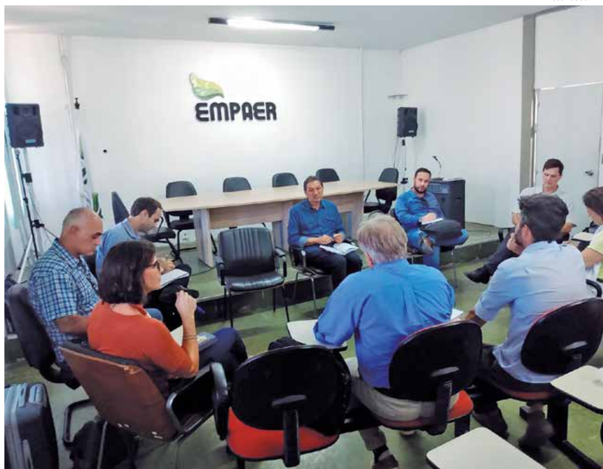
Técnicos consideraram como muito bom o desempenho e os resultados obtidos pelos agricultores familiares

Mesmo conhecendo a atividade de criação de caprinos e ovinos na região, alguns dos estudantes não conheciam o sistema de pesquisa e de criação de caprinos patriciados em Pendência.