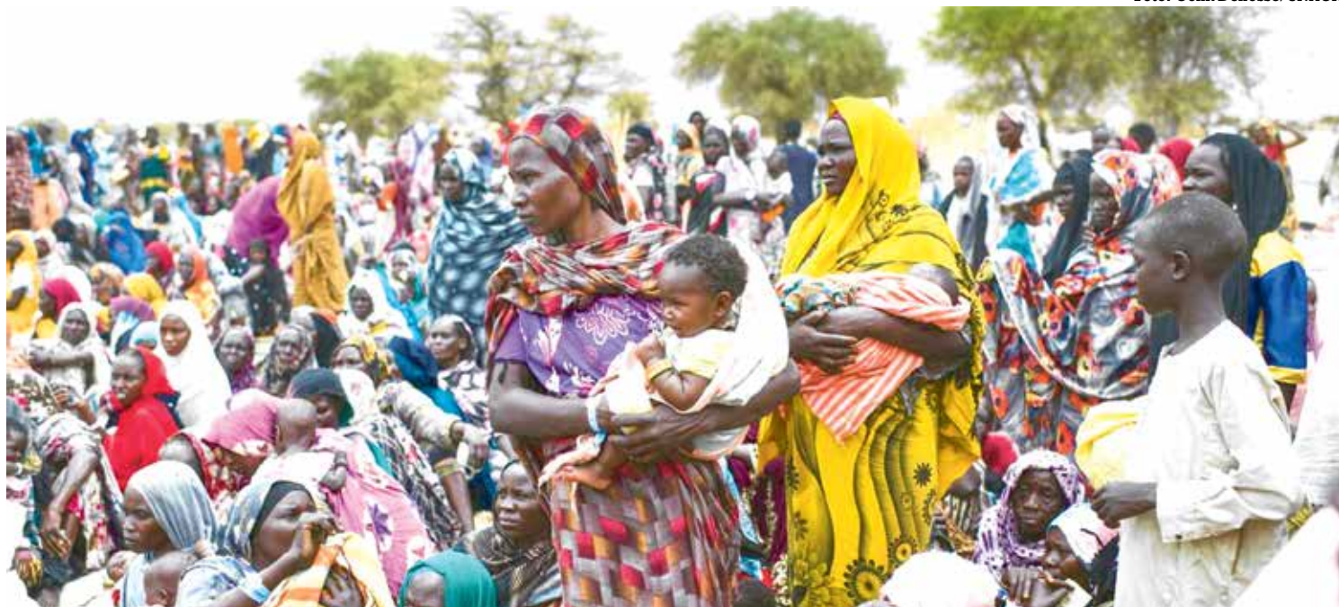
Centenas de refugiados sudaneses que chegaram em Madjigilta, no Chade, se reúnem para receber kits de socorro da Acnur

O Sudão já era um dos países mais pobres do mundo antes do início do conflito, com um terço da população necessitando de assistência humanitária e enfrentando fome aguda.